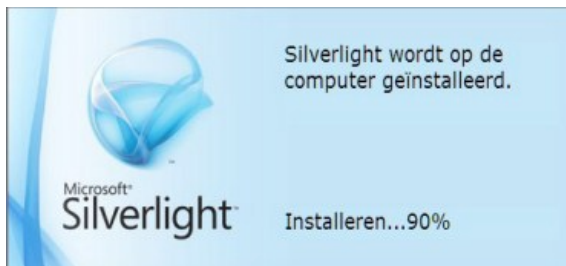
Afbeelding 6 De voortgang van de installatie

Als u op Nu installeren klikt dan begint het installatie proces. U wordt u op de hoogte gehouden van de voortgang van de installatie (Zie afbeelding 6).