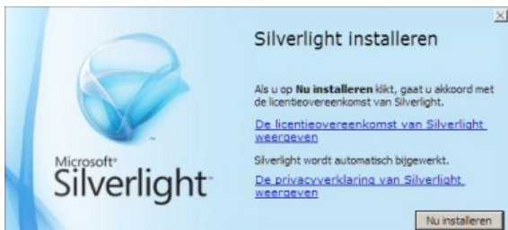
Afbeelding 5 Licentieovereenkomst en privacyverklaring inzien

U kunt Silverlight direct installeren door op Uitvoeren (Run) te klikken. Ook is het mogelijk voorafgaand aan de installatie het eerst op uw computer op te slaan door op (Bestand) Opslaan (Save) te klikken. Kiest u in eerste of in tweede instantie voor Uitvoeren (Run), dan krijgt u de gelegenheid de licentieovereenkomst en de privacyverklaring van Silverlight in te zien (Zie afbeelding 5).