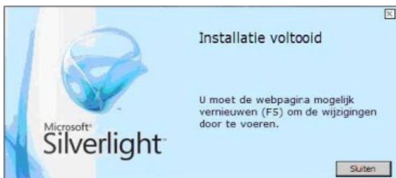
Afbeelding 7 Installatie is voltooid, u hoeft alleen nog de pagina te verversen met de functietoets F5

Tot slot wordt de voltooiing van de installatie aangekondigd en krijgt u het verzoek de webpagina te vernieuwen door op functietoets F5 te drukken (Zie afbeelding 7).